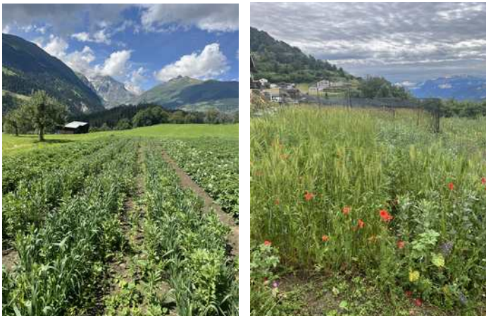
Mischkulturen in Ernen und Erschmatt

Haben Sie 2-4 m 2 Platz in ihrem Garten und möchten zur Erhaltung der Walliser Sortensammlung beitragen? Gerne können Sie sich bei uns melden!