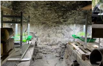
Testanlage im Keller