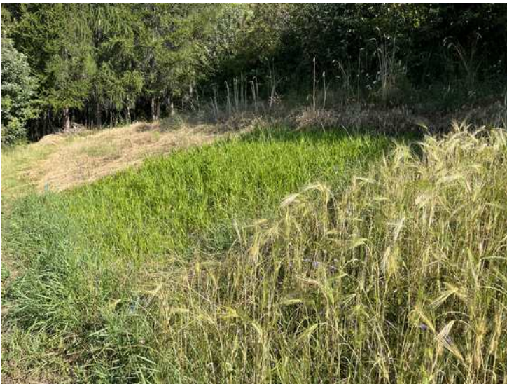
Hirse in der Mitte (grün), rechts Gerste

Auf den oberen Terrassen, die seit 2020 bewirtschaftet werden, wuchs der Roggen sehr schön und lagerte, trotz des starken Wachstums, kaum ab. Somit konnte dort eine gute Ernte eingefahren werden. Die Ernte konnte dank Olivier Bayards Einsatz und Mähdrescher in kurzer Zeit abgeschlossen werden.