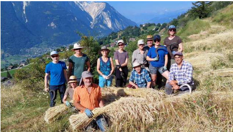
Gemeinsame Roggenernte am 27. Juli – Basis für ein gutes Roggenbrot

Am meisten gefragt sind Backanlässe, bei denen Jung und Alt das Handwerk des Roggenbrotbackens selbst ausführen und am Schluss selbst gebackenes, fein duftendes Brot mit nach Hause nehmen dürfen. Gemeinsames Brotbacken macht Freude und verbindet Menschen.