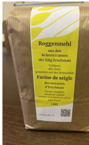
Das Mehl aus unseren Roggenkörnern kann im Konsum in Erschmatt, bei Leuk Tourismus und beim Verein gekauft werden.