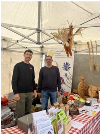
Grand Marché des Terroirs Alpins in Bruson 15./16. Juni 2024